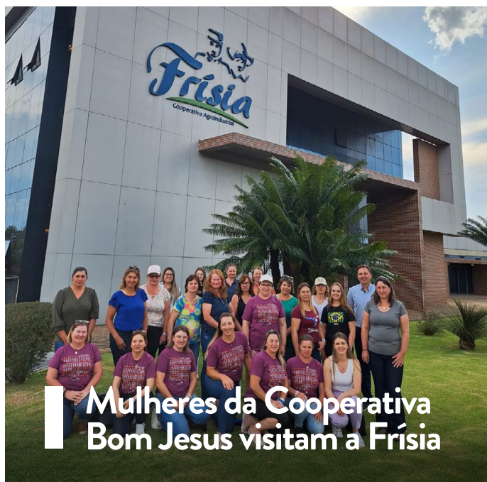
Mulheres da Cooperativa Bom Jesus visitam a Frísia

Na última terça-feira (19), o setor de cooperativismo da Frísia recebeu 30 mulheres da Cooperativa Bom Jesus. As participantes são integrantes do Conselho Fiscal, dos núcleos de mulheres e da liderança jovem. Durante a apresentação institucional, puderam conhecer melhor a história da cooperativa de produção mais antiga do Estado, juntamente com seus negócios, produtos, serviços e projetos de intercooperação, além dos programas socioambientais e incentivos culturais. O evento faz parte do calendário de grupos de imersão da Cooperativa de Turismo Paranaense (Cooptur), para cooperativas que escolhem visitar a Frísia e os pontos turísticos potenciais de Carambeí.