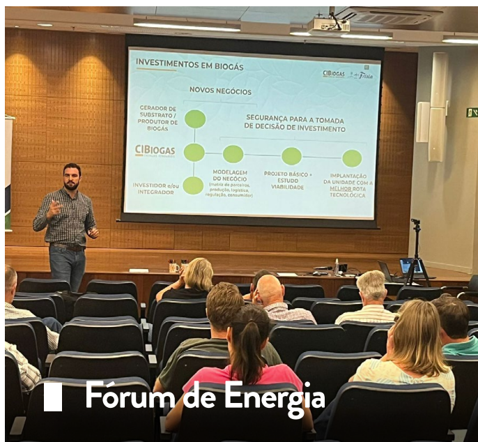
Fórum de Energia

Na última terça-feira (19), o setor de cooperativismo da Frísia recebeu 30 mulheres da Cooperativa Bom Jesus. As participantes são integrantes do Conselho Fiscal, dos núcleos de mulheres e da liderança jovem. Durante a apresentação institucional, puderam conhecer melhor a história da cooperativa de produção mais antiga do Estado, juntamente com seus negócios, produtos, serviços e projetos de intercooperação, além dos programas socioambientais e incentivos culturais. O evento faz parte do calendário de grupos de imersão da Cooperativa de Turismo Paranaense (Cooptur), para cooperativas que escolhem visitar a Frísia e os pontos turísticos potenciais de Carambeí.