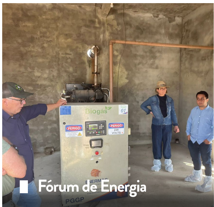
■ Fórum de Energia

Na quinta-feira (21), foram realizadas visitas técnicas em biodigestores de uma propriedade de bovinocultura de leite e à uma usina de tratamento de resíduos, onde os cooperados puderam acompanhar a operação desta tecnologia e observar seus benefícios e suas dificuldades.