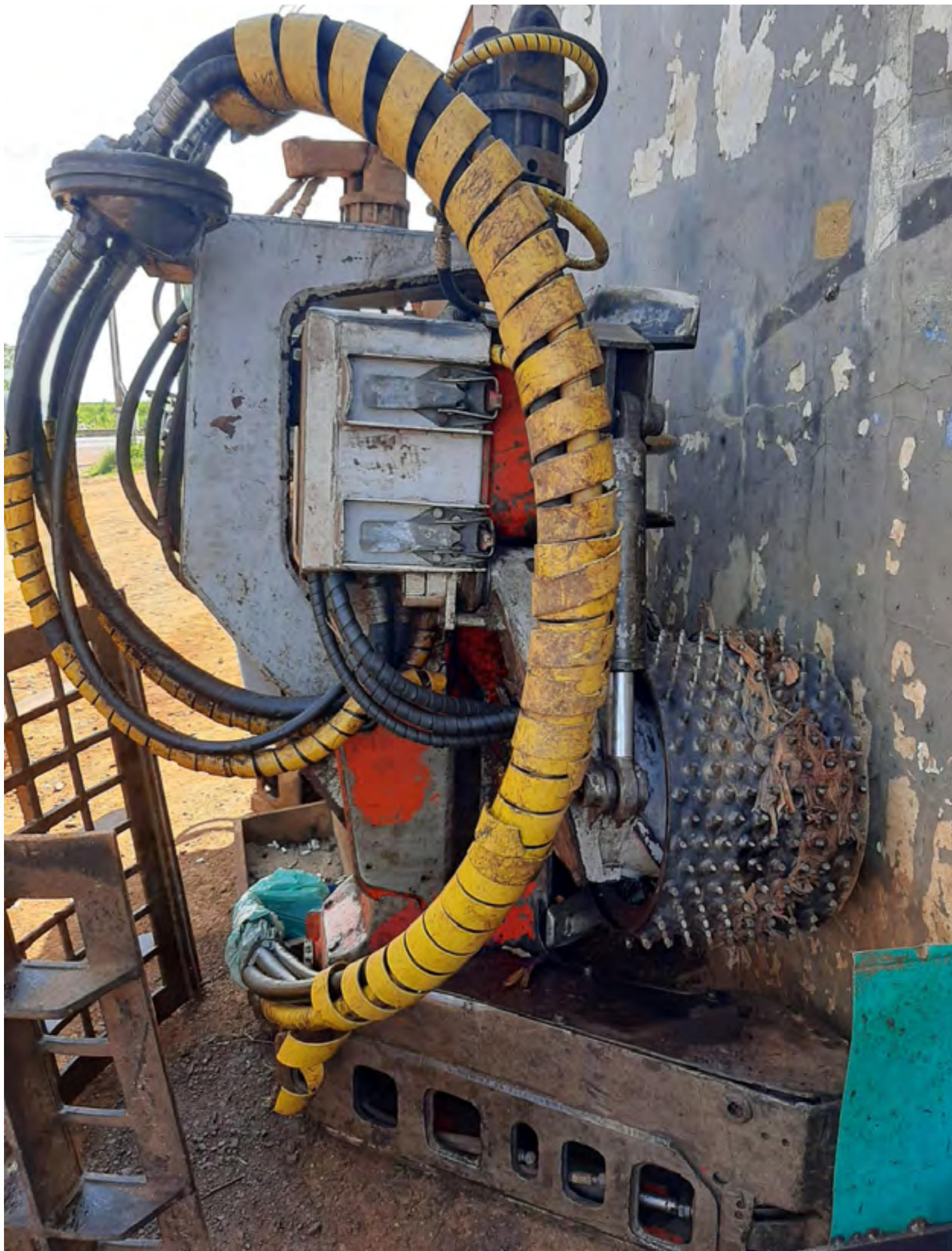
Cabeçote florestal marca Logmax, modelo 6.000B