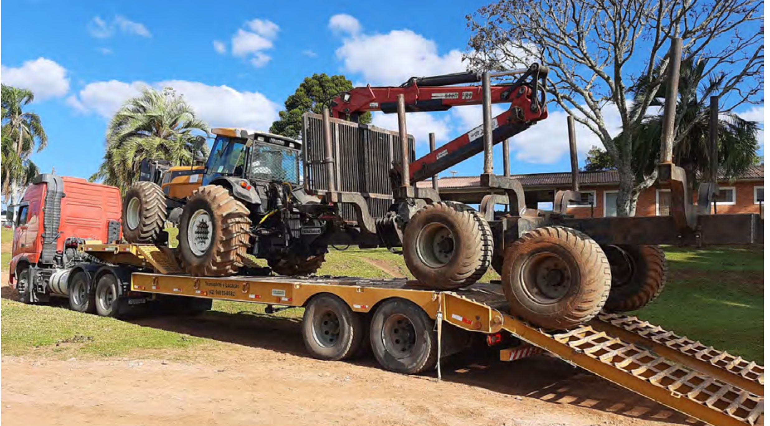
Trator agrícola, marca Valtra, modelo BH180