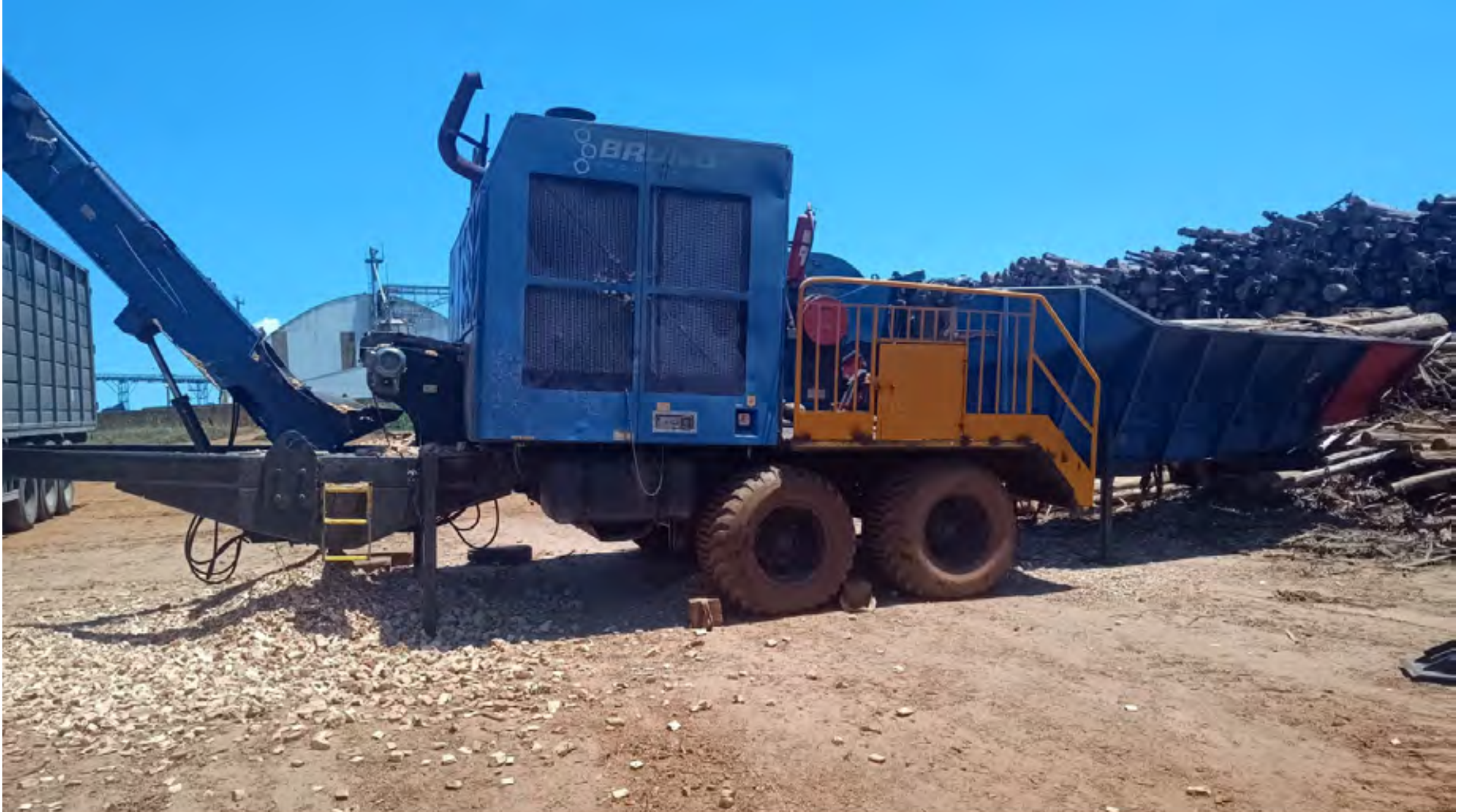
Picador florestal, marca Bruno, modelo Forest King