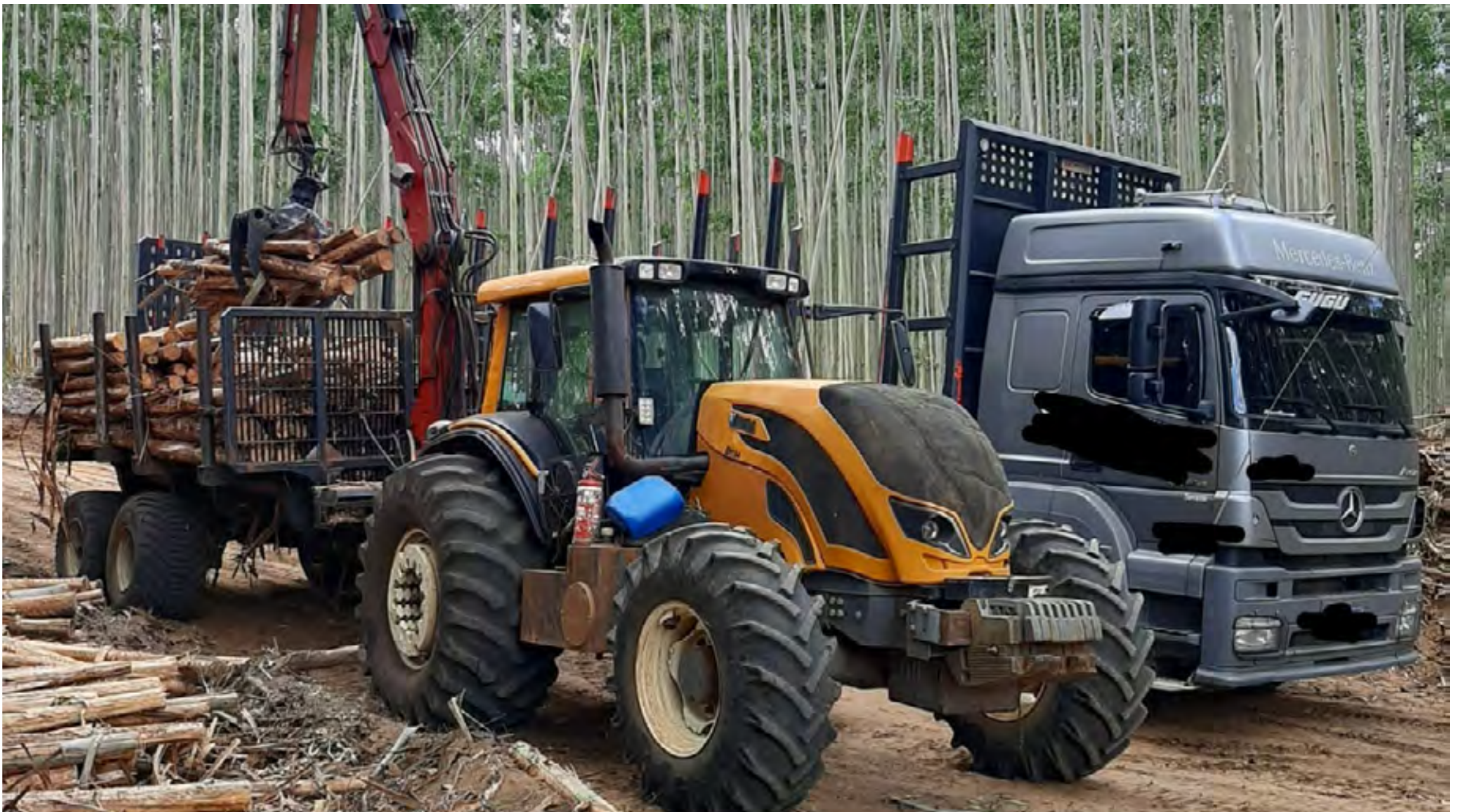
Trator agrícola, marca Valtra, modelo BH194