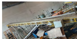
2 - Dala transportadora 10 metros