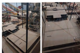
1 - Balança de piso 2.500kg

Não havendo procura até a data estipulada, os equipamentos serão disponibilizados para venda a terceiros.